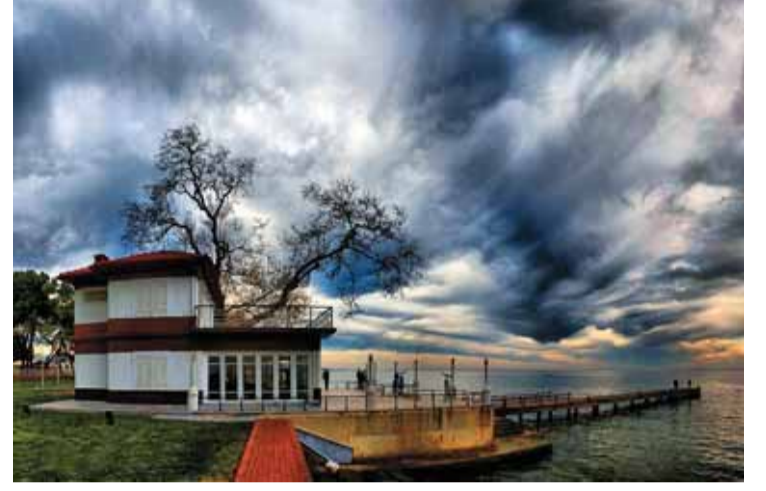
Gökhan Özgür - Yürüyen Köşk

Dergide yayınlanan yazı ve fotoğraflar kaynak gösterilerek dahi kullanılamaz.